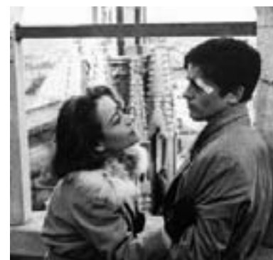
Girardot-Delton, "Rocco e i suoi fratelli"

utilizzata per le celebrazioni del centenario del regista. Il 28 Uomini e no che nel 1980 Valentino Orsini ha tratto dal libro di Elio Vittorini sulla Resistenza. Il 6 marzo è in programma Una vita difficile, di Dino Risì. I problemi della migrazione dal Sud al ricco Nord sono l'argomento comune di Rocco e i suoi fratelli (diretto nel 1960 da Luchino Visconti) e del più recente Così ridevano (Gianini Amelio, 1988). Il percorso cinematografico si chiude con Celluloide, la pellicola di Carlo Lizzani del 1996 dedicata alla lavorazione di Roma città aperta. Il percorso della memoria invece è riaperto il 3 e 17 aprile dal documentario di Liliana Cavani Le donne della Resistenza e da una selezione di testimonianze audiovisive. In alternanza due lavori teatrali di compagnie giovani: il 10 aprile al Verdi La bella gioventù, frutto della ricerca di Cada Die Teatro sugli anni '40 a Cagliari, dalla fine del fascismo ai bombardamenti; l'8 maggio